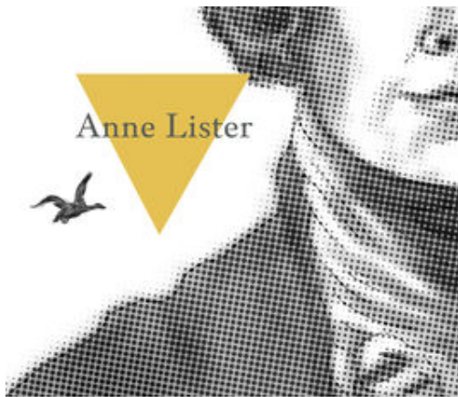
Caballero Jack Los diarios de Anne Lister